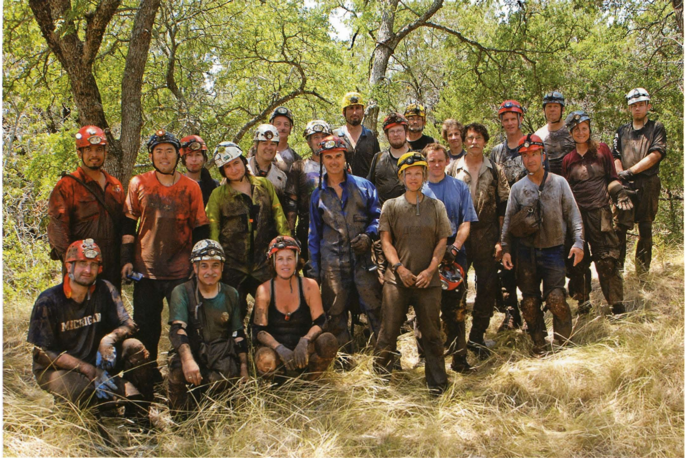
Печерний інтернаціонал. Усі брудні, мокрі й задоволені.